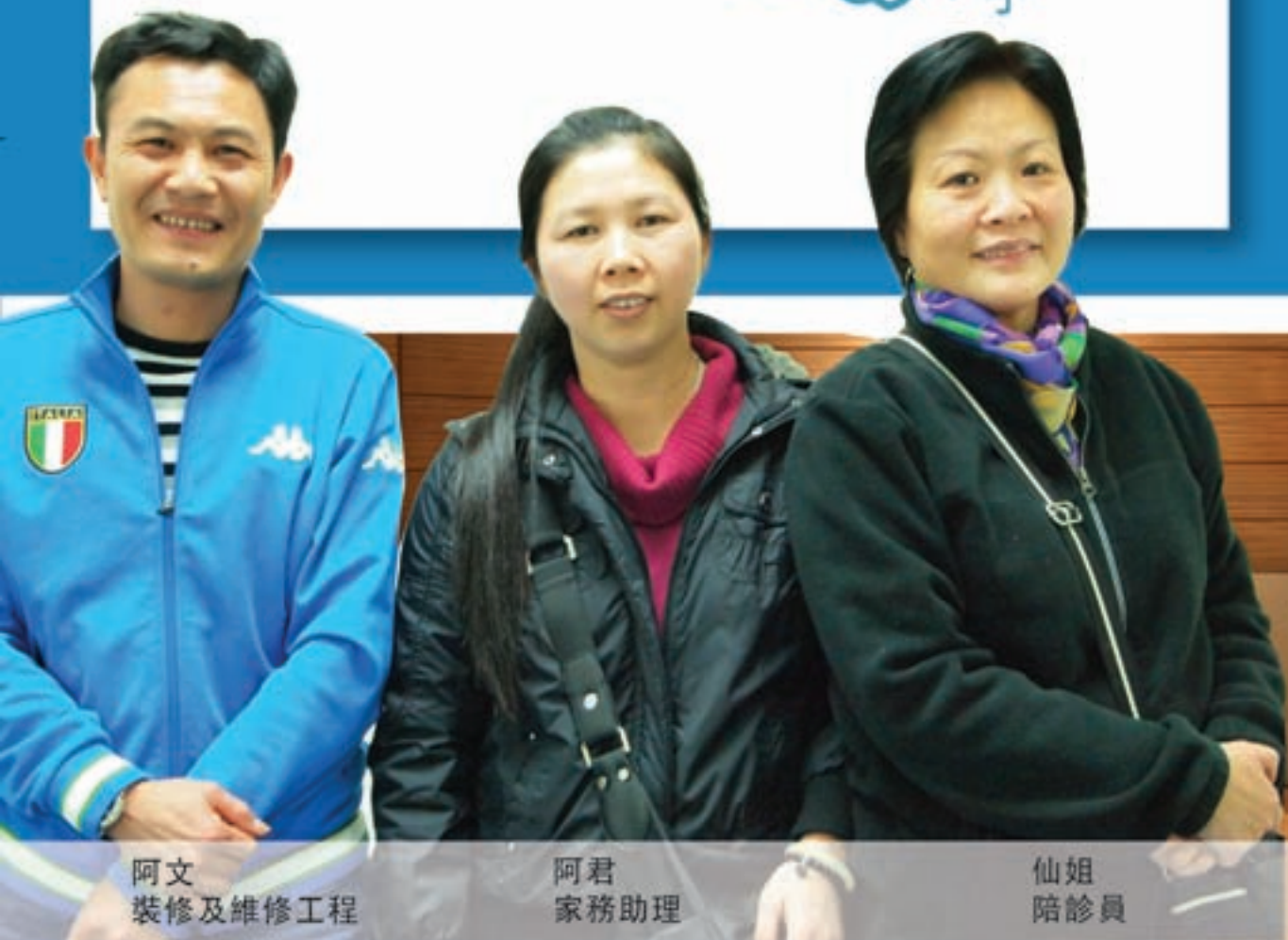
阿文 裝修及維修工程